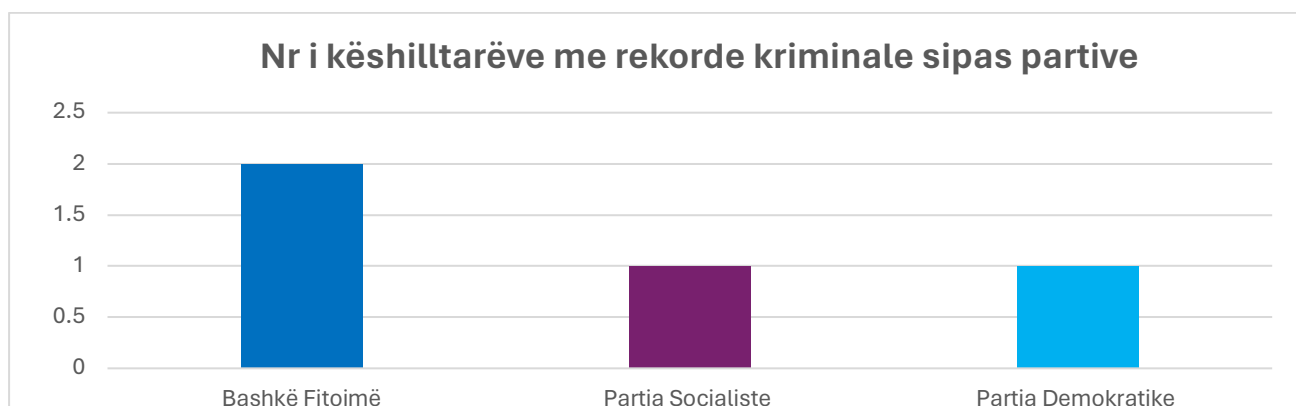
Tabela 1_Nr. i këshilltarëve me rekorde kriminale sipas partive- qarku Shkodër

Sa i përket përkatësisë politike, në këshillin bashkiak Shkodër, rezulton se koalicioni Bashkë Fitojmë dhe Partia Socialiste kanë promovuar nga një kandidat me rekorde kriminale E.D (BF) dhe U.GJ (PS), ndërsa PD ka një anëtar (GJ.M) me rekorde kriminale në këshillin bashkiak Vau-Dejës. Malësia e Madhe rezulton me këshillin bashkiak më të pastër, pa asnjë anëtar me rekord kriminal.